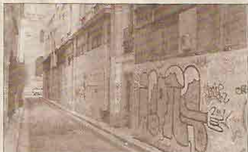
Tags, affichage sauvage et déjections canines font de ce bout de rue un endroit sordide

De notre correspondant local Fabien Crosset